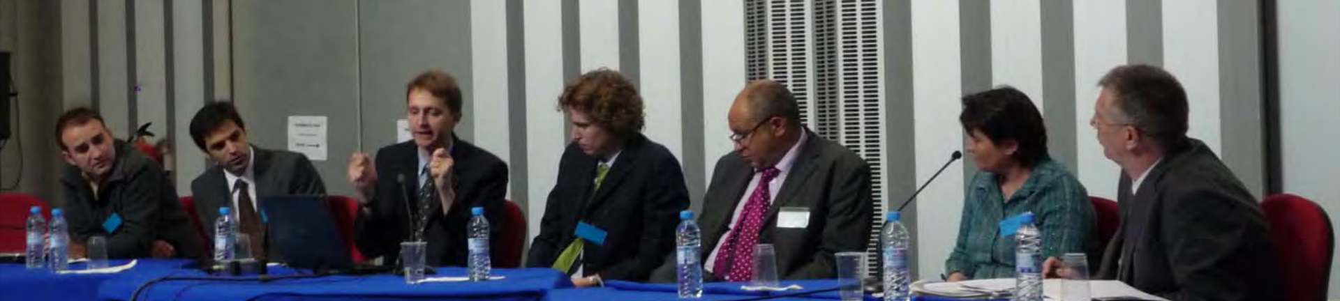
Jornadas transpirenaicas de valorización de la I+D+i, Sectores Espacial, Salud y TIC - Viladecans (Barcelona), 29 y 30 de abril 2009